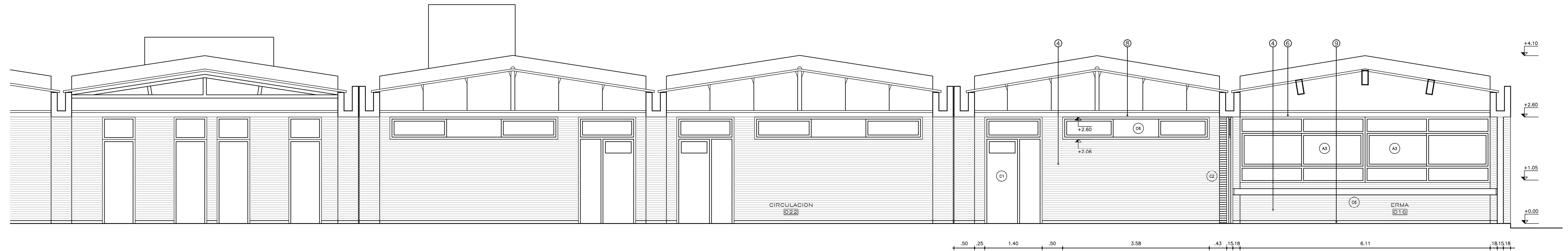
CORTE BB ESC.1:50